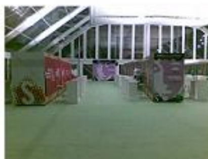
Calle stands expositores