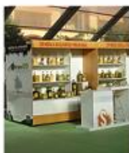
Stand personalizado para muestra Oleum 09