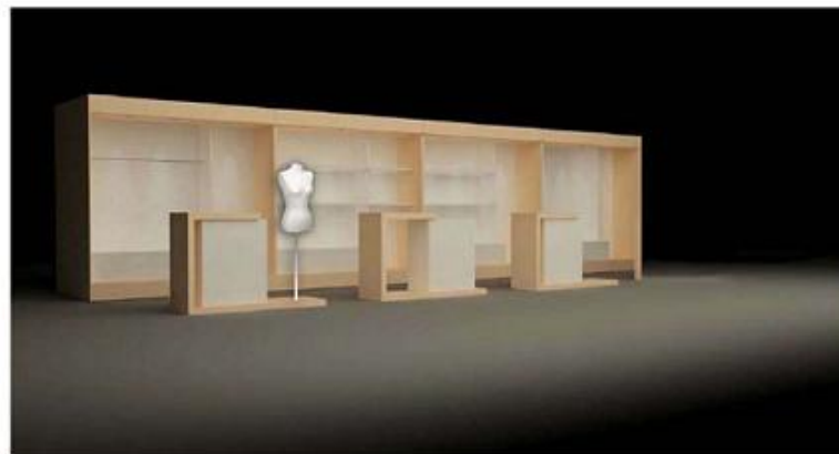
Diseño 3D stands expositivo