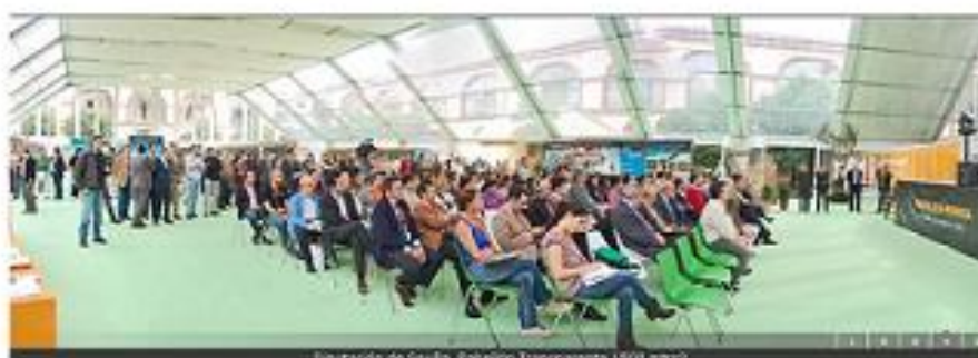
Vista general Carpa Transparente