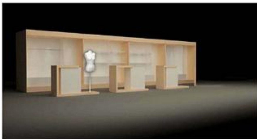
Diseño 3D stands expositivo